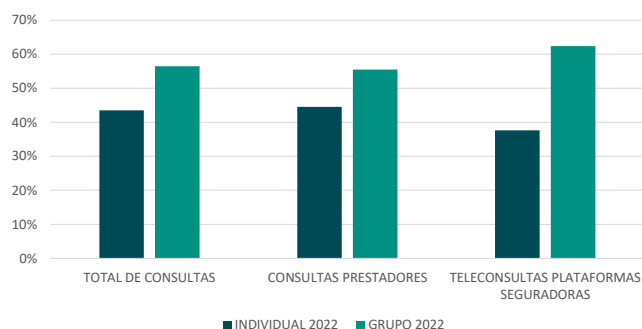
GRÁFICO 3 - DISTRIBUIÇÃO POR FORMA DE SEGURO 2022

No mesmo período, os seguros individuais foram responsáveis por cerca de 40% das consultas por este meio.