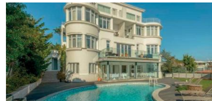
AMAZÓNIA ESTORIL HOTEL **** www.amazoniahoteis.com

All reservations must be booked directly via the hotel, via the hotel site: www.vilagale.com Use code: ER2026APS