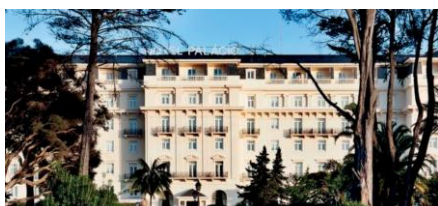
PALÁCIO ESTORIL HOTEL, GOLF & WELLNESS ***** www.palacioestorilhotel.com

Todas as reservas devem ser feitas diretamente, pelo site do hotel: www.palacioestorilhotel.com Use o código: XX2026APS