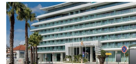
HOTEL EVOLUTION CASCAIS - ESTORIL **** www.sanahotels.com

All reservations must be booked directly via the hotel site: www.amazoniahoteis.com Use code: ER2026