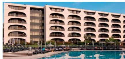
HOTEL VILA GALÉ ESTORIL **** www.vilagale.com

All reservations must be booked directly via the hotel site: www.palacioestorilhotel.com Use code: XX2026APS